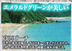
高浜ビーチ 突然の急流が押し寄せては日本一の美しさも言われ、白砂の浜を透視度が高い綺麗な海が広がります。

大瀬崎断崖展望所 高さ100~160mの海食崖が見られ、海的美しさで感動できる絶景ポイントです。