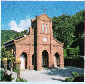
堂崎天主堂 ゴシック様式のレンガ造りの教会。内部を彩るステンドグラスが見事です。

2007年に世界文化遺産候補に「頭ヶ島教会」や「堂崎天主堂」などが登録されています。