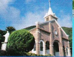
井持浦教会・ルルド 明治32年に日本で初めて作られた「ルルドの洞窟」があり、信仰の聖地として全国から巡礼団が訪れます。